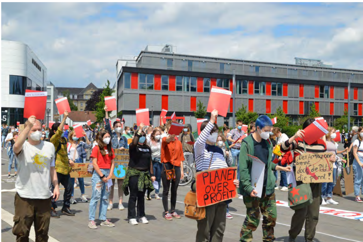
FFF-Demo in Bonn am 02.07.2021

Weitere Fotos mit Roten Klimakarten aus anderen Städten auf www.roteklimakarte.de